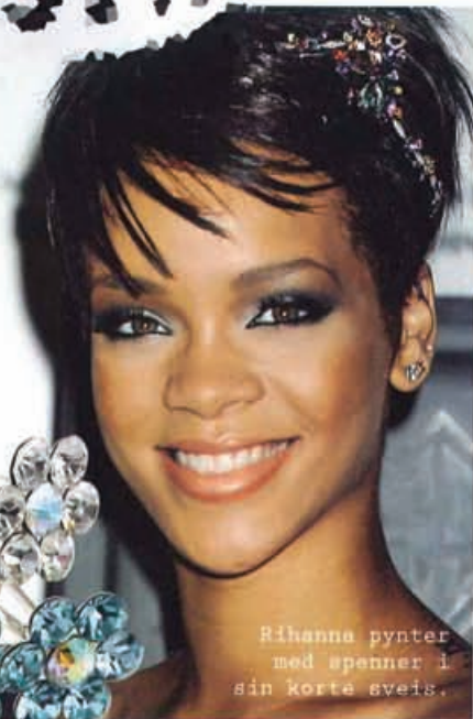
Rihanna pynter med spenner i sin korte sveis.