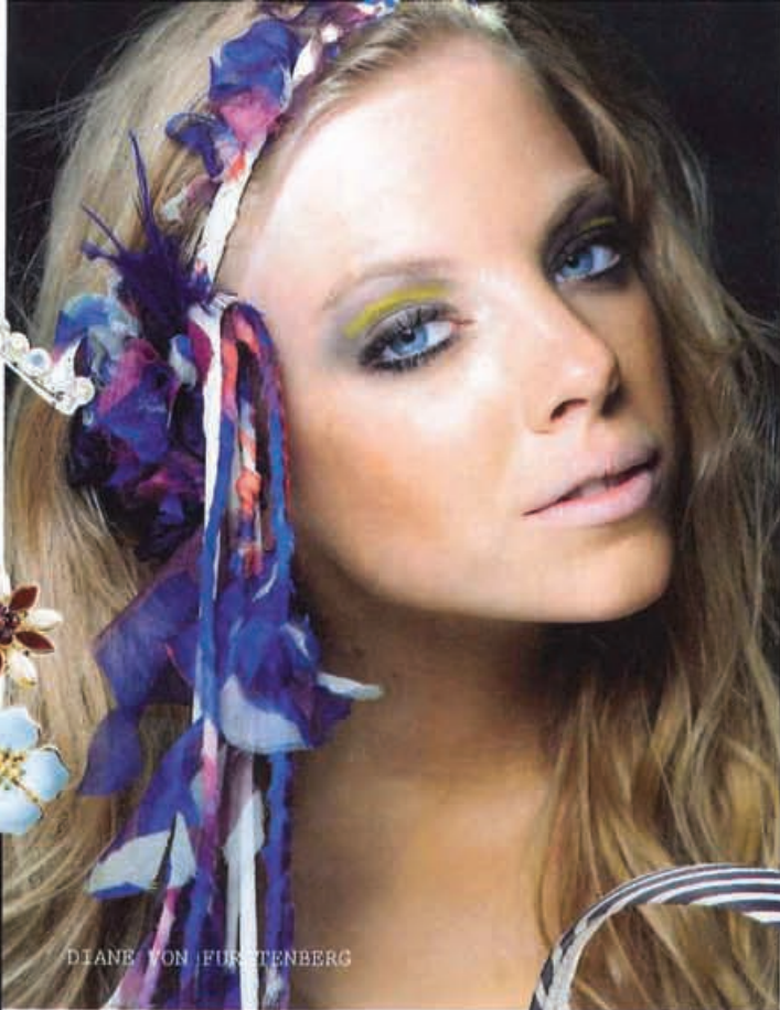
DIANE VON FURSTENBERG