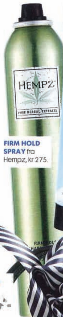
FIRM HOLD SPRAY fra Hempz, kr 275.