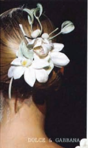
DOLCE & GABBANA